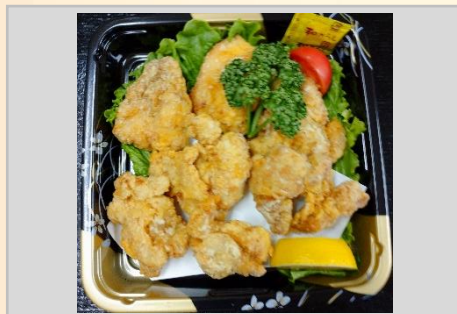
700円 外はサクサク中はジューシー 若鶏から揚げ