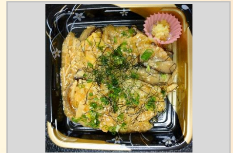
600円 野菜あんかけ 揚げだし豆腐