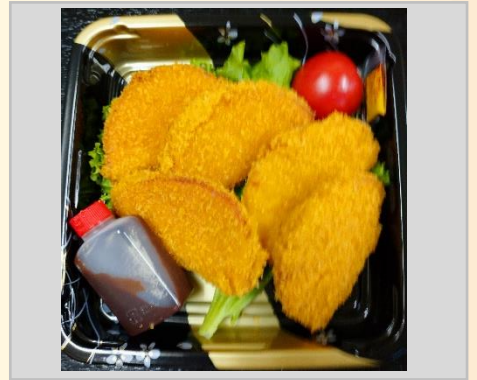
500円 いつでも美味しい ハムカツフライ