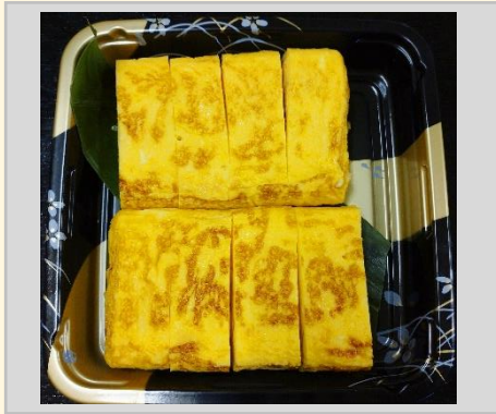
500円 甘じょっぱい 玉子焼き